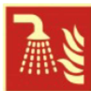
Stołe urządzenie gaśnicze – instalacja tryskaczowa