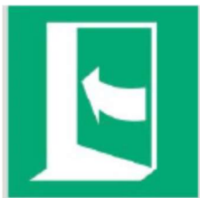
Pchac po lewej stronie aby otworzyć