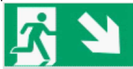
Kierunek drogi ewakuacyjnej w dół w prawo