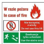
W razie pożaru nie korzystaj z windy. Ewakuacja tylko schodami