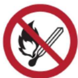
Zakaz używania otwartego ognia – palenie tytoniu zabronione