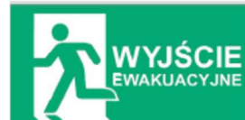
Wyjście ewakuacyjne lewostronne