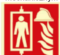
Dźwig dla ekip ratowniczych