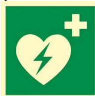
Wskazuje miejsce, w którym znajduje się automatyczny defibrylator zewnętrzny (AED)