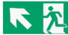
Kierunek drogi ewakuacyjnej w górę / na ukos w lewo