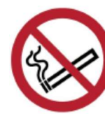
Palenie tytoniu zabronione