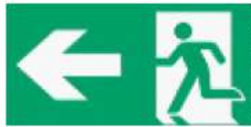
Kierunek drogi ewakuacyjnej w lewo / wzdłuż