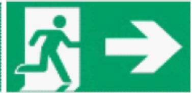
Kierunek drogi ewakuacyjnej w prawo / wzdłuż