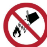
Zakaz gaszenia wodą