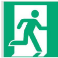
Wyjście ewakuacyjne prawostronne