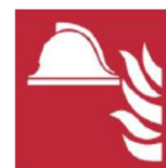
Zestaw sprzętu przeciwpożarowej