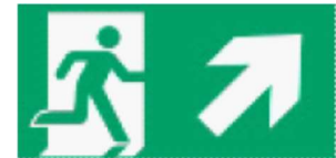
Kierunek drogi ewakuacyjnej w górę / na ukos w prawo