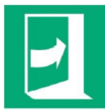
Pchac po prawej stronie aby otworzyć