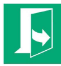
Ciągnąć z lewej strony aby otworzyć