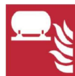
Stoła instalacja gaśnicza