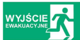
Wyjście ewakuacyjne prawostronne