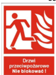
Drzwi przeciwpożarowe lewe / prawe – nie blokować