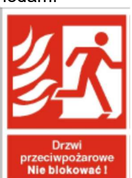
Drzwi przeciwpożarowe lewe / prawe – nie blokować