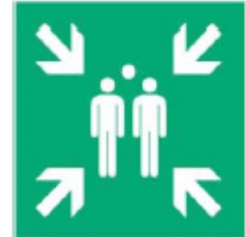
Miejsce zbiórki ewakuacji