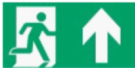
Kierunek drogi ewakuacyjnej w górę / na wprost/ przez drzwi prawostronne