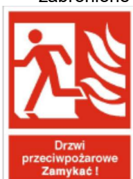
Drzwi przeciwpożarowe lewe / prawe – zamykać