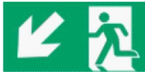
Kierunek drogi ewakuacyjnej w dół w lewo