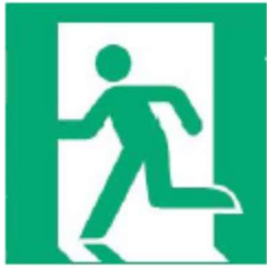
Wyjście ewakuacyjne lewostronne