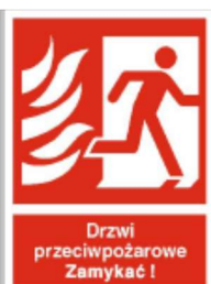
Drzwi przeciwpożarowe lewe / prawe – zamykać