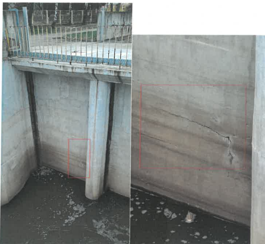
Zdj. 4,5 Rysa w strukturze na powierzchni betonowej studni lewarowej nr.1