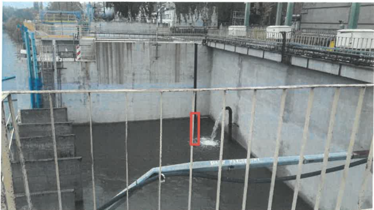
Zdj. 2,3. Kanał zrytowy – 2 i 4 odcinek (remont dylatacji w cz. podwodnej)