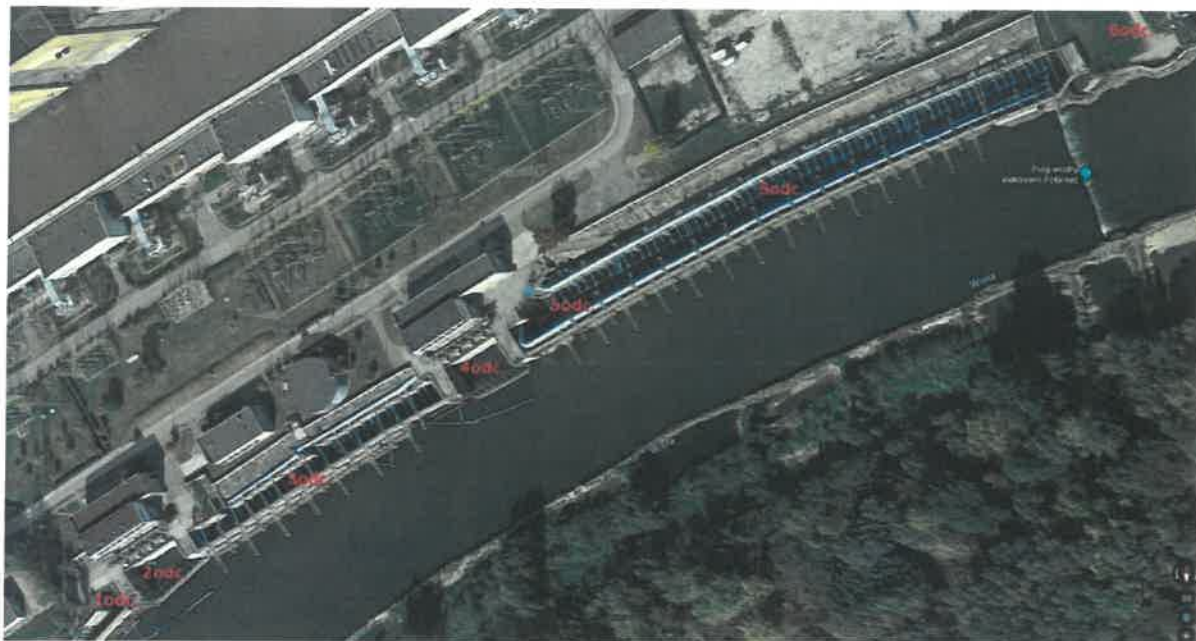
Zdj. 1. Kanał zrzutowy – numeracja odcinków kanału zrzutowego