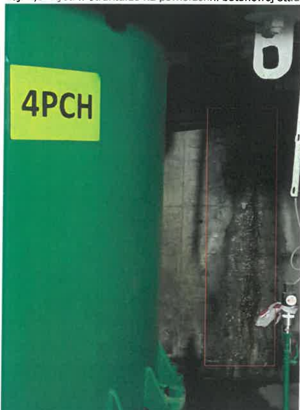
Zdj. 6 Pompownia C-1 rysy na strukturze ścian