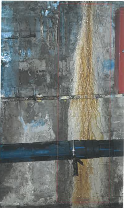
Zdj. 7 Pompownia C-1